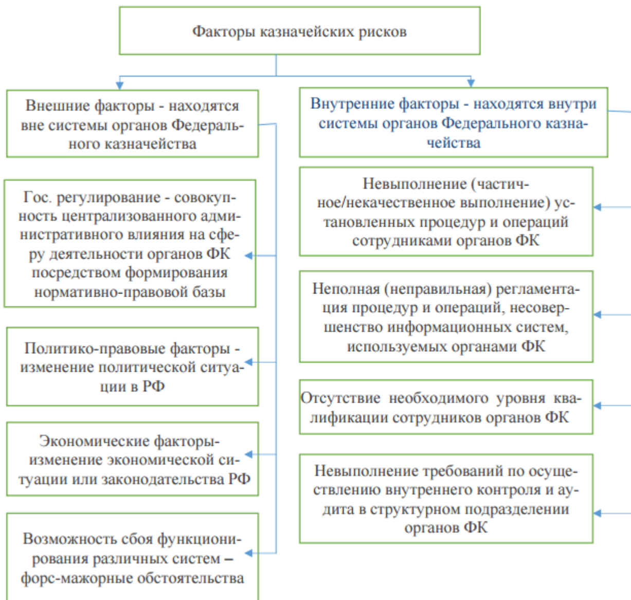
Рис. 3 Классификация факторов рисков в органах Федерального казначейства РФ

Для вышеперечисленных нарушений органы внешнего контроля, к следует отнести: