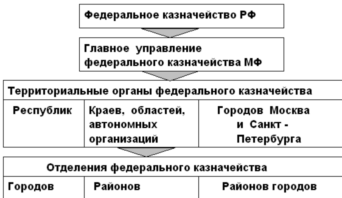
Рис.1 Структура органов Федерального РФ[4]

Структура территориальных казначейства является :